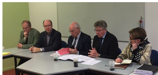
Signature de la convention d'OPAH le 11 décembre 2017 par le Président du Conseil Départemental, délégataire des aides de l'Anah

Cette opération a pour but de créer des conditions plus favorables, en apportant informations et conseils sur les travaux, visites à domicile, aide au montage des dossiers et obtention de primes non remboursables.