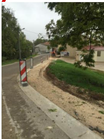
Rue Principale, Maizey