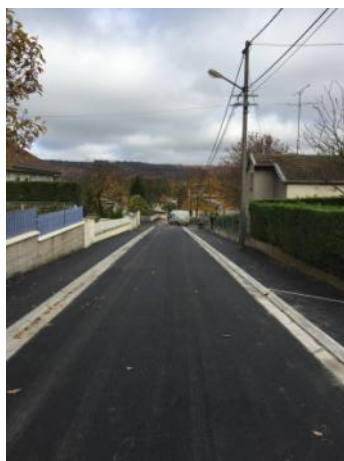
Rue Henri Alain Fournier, Saint-Mihiel