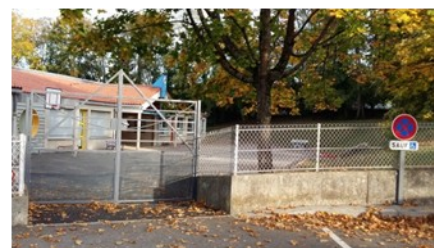
Portail côté primaire rehaussé

Pour la sécurité de l'école l'ouverture des portails se fait désormais via un visiophone.