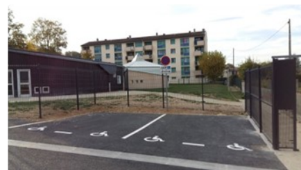
Places de parking PMR créées

Harmonisation des tarifs de Cantine et de Garderie :