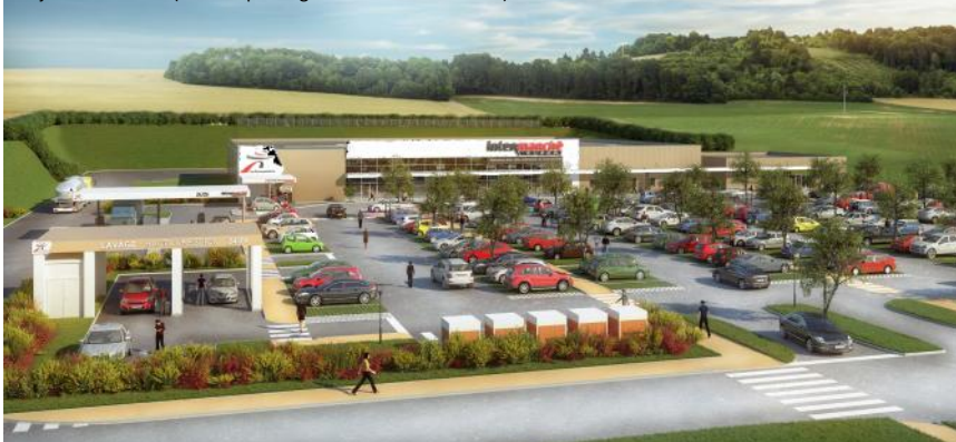
Projet Intermarché (Plan 3D par l'Agence ACCORD ET ARCHI)

Aujourd'hui, 62% des habitants vont faire leurs courses en dehors de notre territoire parce qu'ils ne trouvent pas sur place ce qu'ils recherchent. Cette évasion commerciale n'est pas sans conséquence pour les petits commerces locaux qui perdent un potentiel de clientèle important.