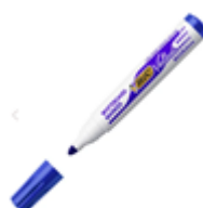
un feutre d'ardoise