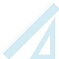
une règle 20cm et une équerre