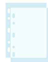
50 pochettes transparentes