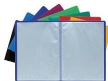
2 portes-vues de 100 vues