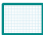
une ardoise blanche