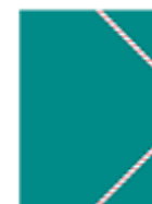
2 pochettes à rabats