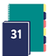
un agenda ou cahier de texte