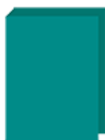
un grand classeur