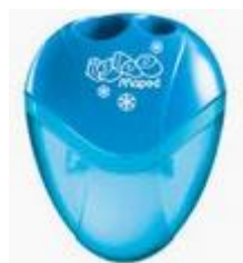
un taille-crayon avec réservoir