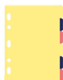
6 intercalaires cartonnés