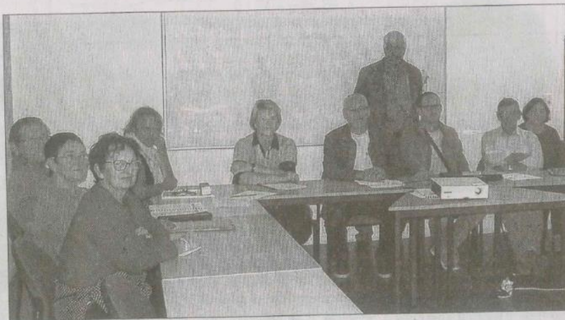
■ Quinze élus vont devenir des éco-citoyens modèles.

L'opération d'une durée de trois mois a débuté en septembre avec la pesée des déchets sans aucune modifica-