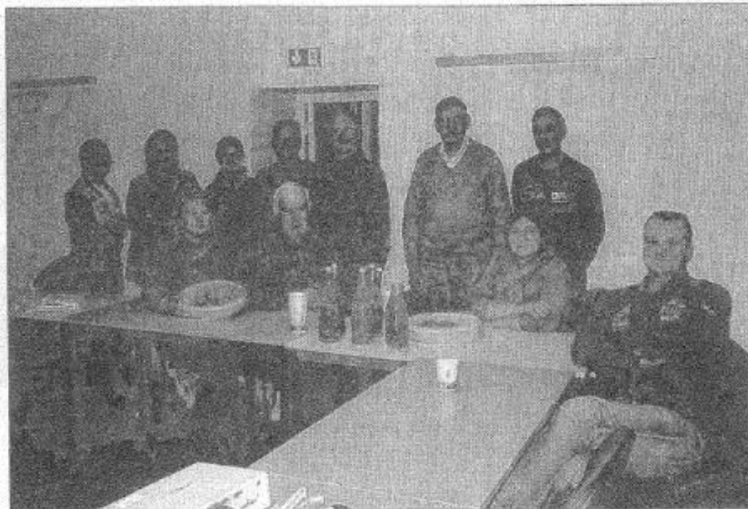
■ L'opération « élus témoins » s'est terminée autour d'un « apéro zéro déchets ».

Les résultats obtenus durant ces deux phases ont été rapportés à l'année pour fai-