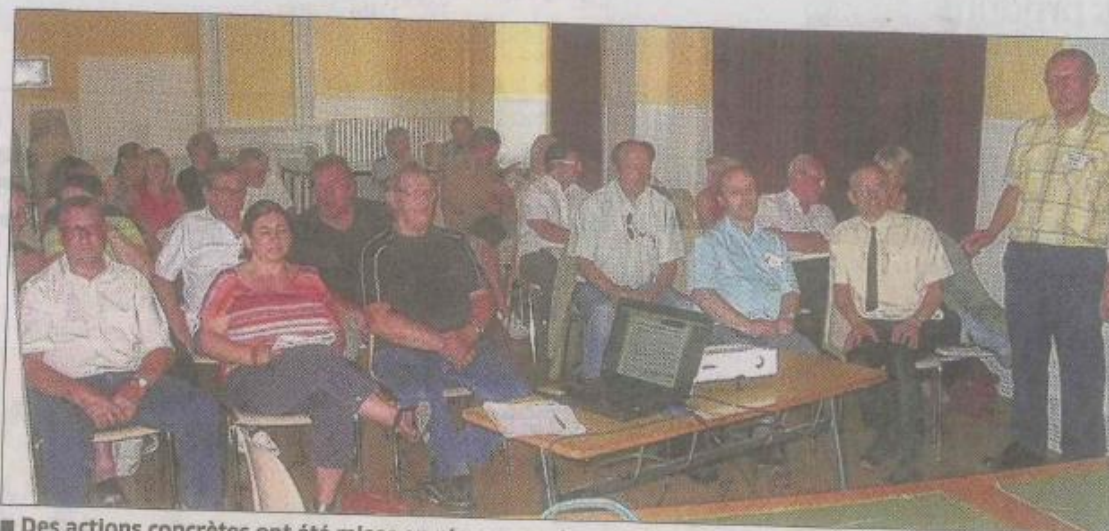
■ Des actions concrètes ont été mises en place pour devenir des citoyens modèles.

L'an passé, la Codecom a mené l'opération « Foyers témoins » qui consistait à sensibiliser les habitants aux gestes de réduction des déchets. Il s'agissait pour eux de connaître la quantité produite au sein du logis en pesant durant trois mois : les sacs d'ordures ménagères et de tri sélectif ainsi que le verre déposé dans les bornes mises à disposition sur