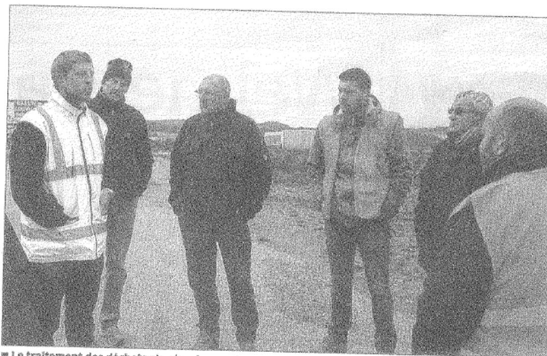
■ Le traitement des déchets n'a plus de secrets pour les élus.

Le centre de traitement des déchets Maxival de Villers-la-Montagne (54) a également ouvert ses portes aux