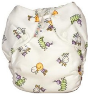
Une culotte de protection imperméable à pression