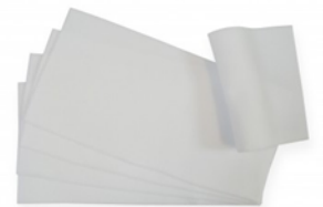
Une lingette, permettant de recueillir les selles et à déposer dans les toilettes