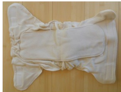
Une couche absorbante à pression