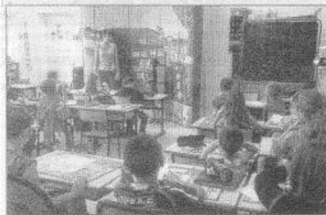
■ Sensibilisation des élèves de l'école de Troyon sur les bienfaits du tri des déchets.