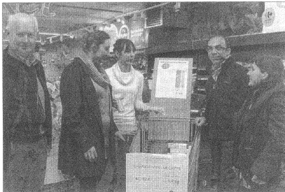
■ L'opération « caddies malins » a permis de sensibiliser les consommateurs.

En effet, les marchés pris individuellement par chaque codecom ne permettent pas de peser sur le prestataire, toujours le même, qui dans une situation de monopole pratique sa politique des prix. Regroupées au sein d'un même appel d'offres les communes meusiennes représenteront un gros marché qui devrait alors intéresser d'autres prestataires. La codecom attend donc de la création de ce syndicat à vocation unique, des économies d'échelles liées à l'effet de