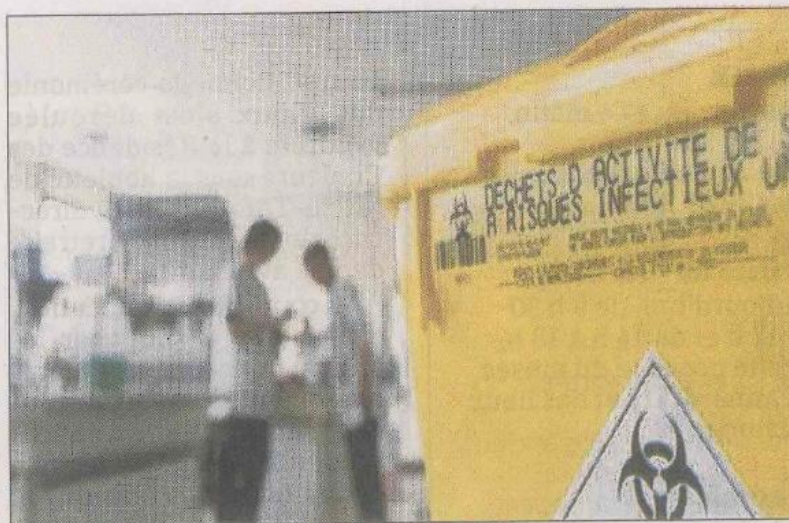
■ Les déchets d'activités de soins à risque infectieux (dasri) sont désormais collectés à la déchetterie.

Aussi, pour contribuer à la traçabilité et au respect de la réglementation en vigueur du Code de Santé publique, les patients en auto traitement, tels les diabétiques insulino-dépendants, peuvent déposer leurs déchets d'activités de soins à risques infectieux à la déchetterie. La Codecom du sammiellois vient d'intégrer le réseau de collecte de